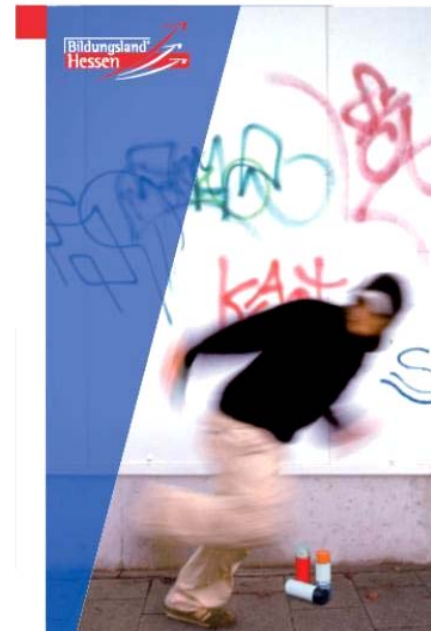
Flyer des Hessischen Landespräventionsrates