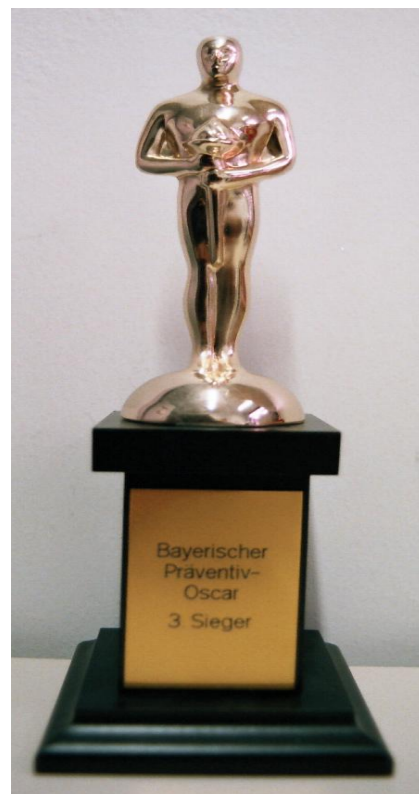
Bayerischen Präventiv-Award 2006